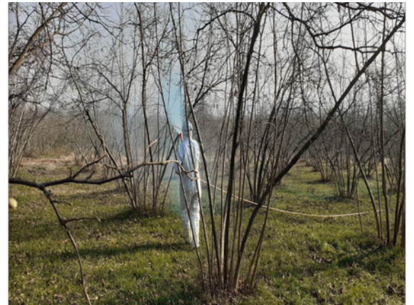
Bordo Bulamacı Uygulaması