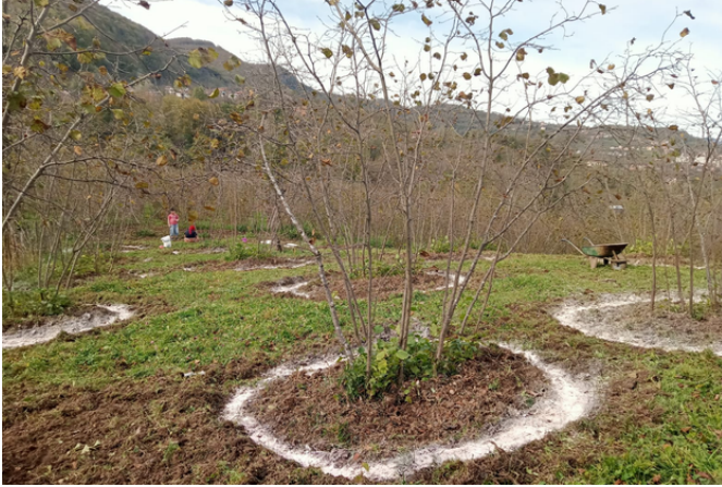
Fındıkta Kireç Uygulaması